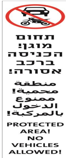
י"ח באדר התשע"ח (5 במרס 2018) (חמ 5053-3)